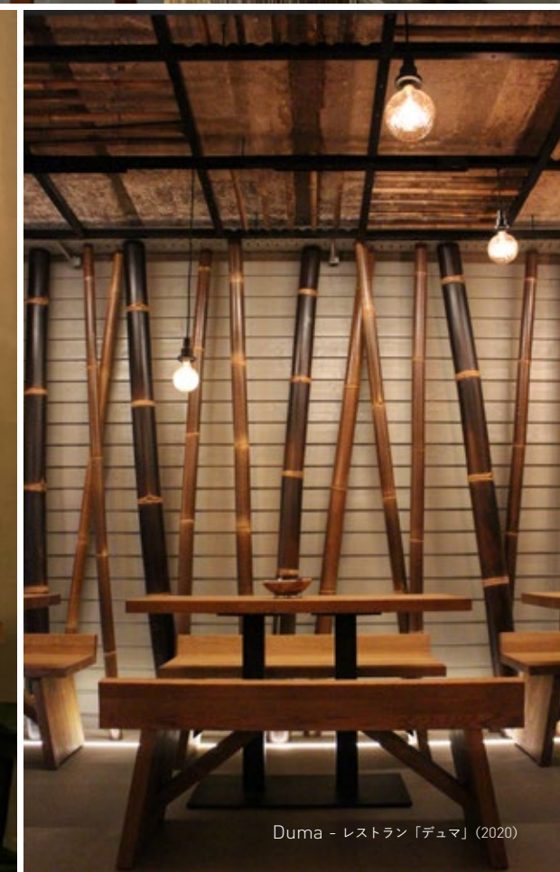
Duma - レストラン「デュマ」(2020)